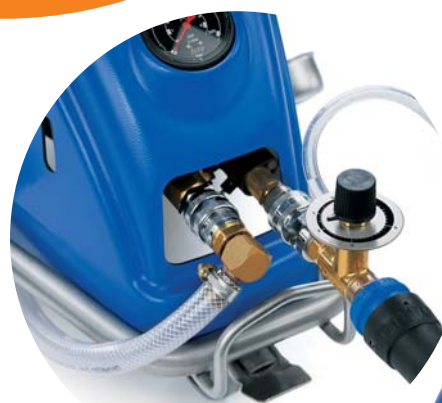
Odolné čerpadlo C3 pro extrémní zátěž.